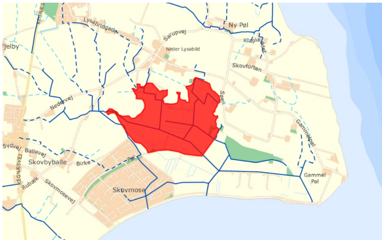
Projektområdet i Birkepøl.

Ligesom det nu realiserede projekt Bundsø er projektet i Birkepøl et vådområdeprojekt, som skal fjerne kvælstof fra vandmiljøet inden vandet ledes ud i havet. Dette sker for at forbedre vandkvaliteten i kystvandområdet Flensborg Ydrefjord.